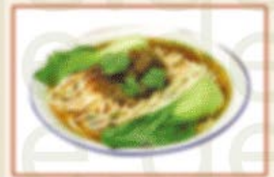
H3. 红烧牛腩面 Nudeln mit geschmortem Rindfleisch A,F 10,00€