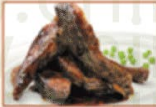
K6. 五香熏鱼 Fünf-Gewürze geräucherter Fisch D,F 12,00€