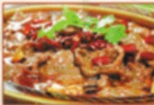
W2. 水煮牛肉 Scharf gekochtes Rindfleisch C,F )) 20,00€