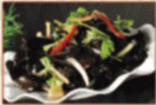
K5. 老醋木耳 Schwarze Pilze in Essigsauce 4 8,00€