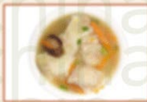
H8 馄饨 Wontonsuppe A 8,00€