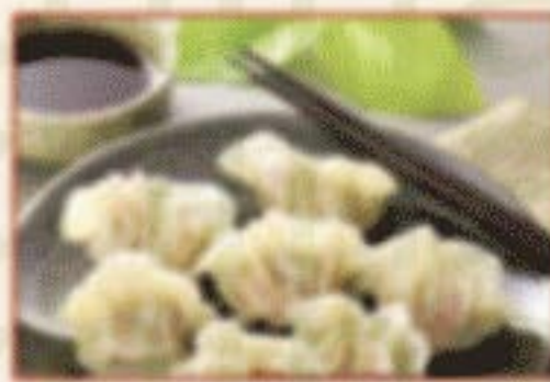
H5. 猪肉白菜水饺 Schweinefleisch-Kohl- Dumplings C,O 14,00€