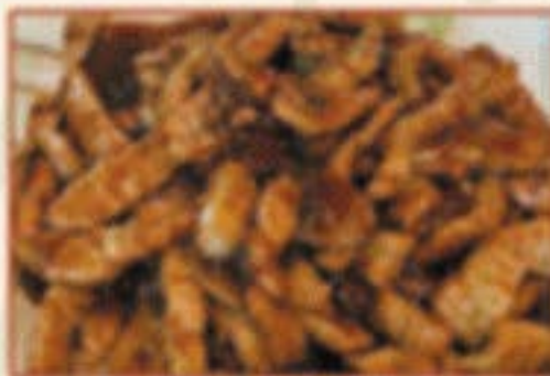
W6. 京酱肉丝 Schweinefleisch in Peking-Bohnenpaste C,F,O 17,00€