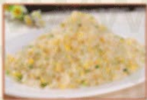
H7. 葱花蛋炒饭 Gebratener Reis mit Ei und Frühlingszwiebeln C 9,00€