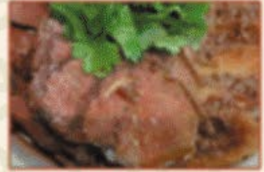
K4. 酱牛肉 In Sojasauce geschmortes Rindfleisch F,4 12,00€