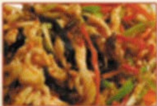
W5. 鱼香肉丝 Schweinefleischstreifen in )) Knoblauchsauce C,O,4 16,00€