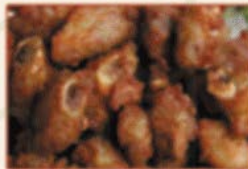
W7. 蒜香小排 Knoblauchrippchen F,L 18,00€