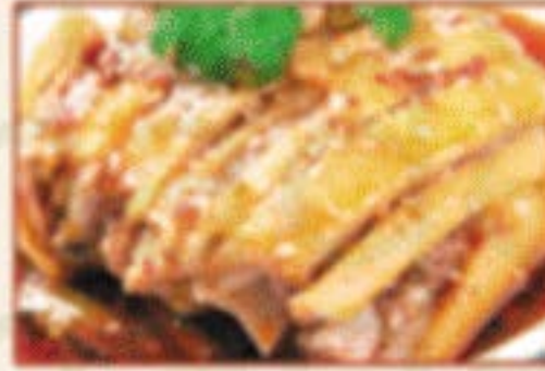
K3. 口水鸡 Scharfes Hähnchen in Sesam-Chili-Sauce N,4 )) 8,00€