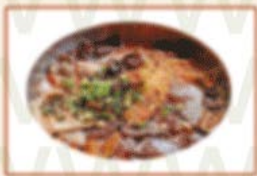
H4. 肠旺面 Nudeln mit Darm und Blutwurst A )) 12,00€