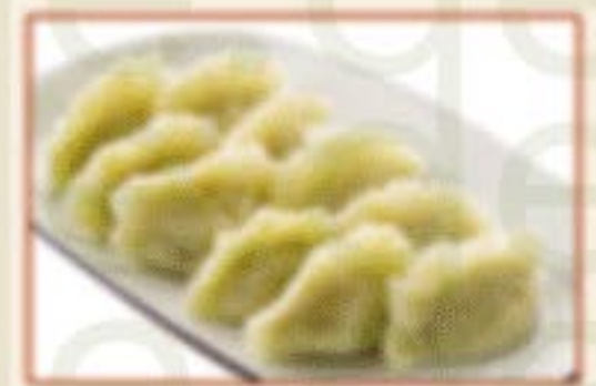
H6. 三鲜水饺 Meeresfrüchte-Dumplings (Garnele, Tintenfisch, Jakobsmuschel) B,D,R 15,00€