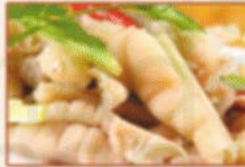
K7. 柠檬凤爪 Hähnchenfüße in Zitronenmarinade 4 10,00€