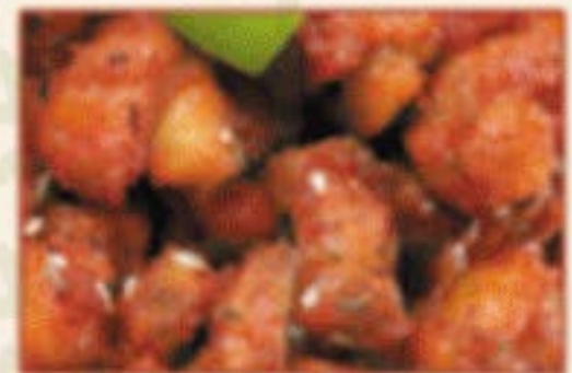
W8. 孜然脆骨 Krosses Knorpelfleisch mit Kreuzkümmel F,L 18,00€