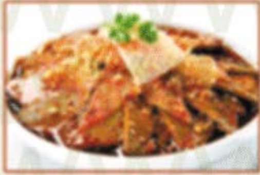
K1. 夫妻肺片 Rindfleisch & Rinderkutteln nach Sichuan-Art F,4 )) 12,00€