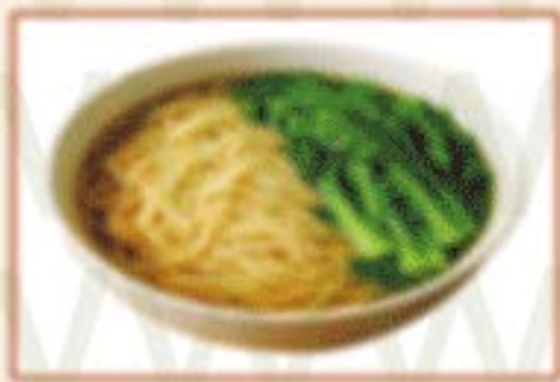
H1. 青菜面 Gemüsenudeln A 8,00€