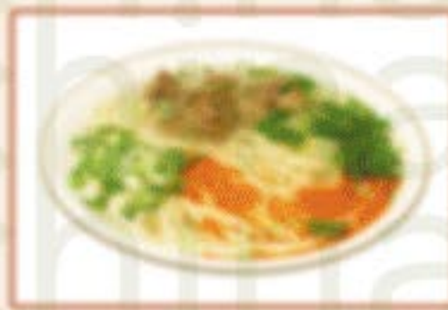
H2. 清汤牛肉面 Rindfleischnudeln in klarer Brühe A,C 10,00€