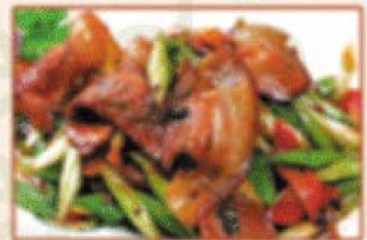
W4. 回锅肉 Doppelt gebratenes Schweinefleisch F,O )) 18,00€