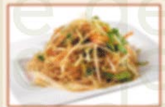
H9. 炒米粉 Gebratene Reisnudeln A,C 10,00€