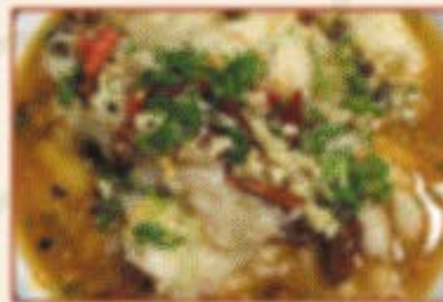
W3. 水煮鱼 Scharf gekochter Fisch D,4 )) 18,00€