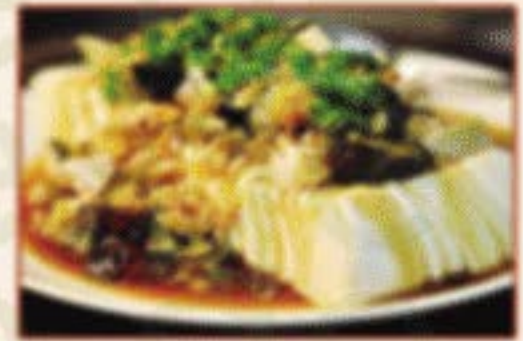
K8. 皮蛋豆腐 Tofu mit hundertjährigem Ei C,F 8,00€ ))