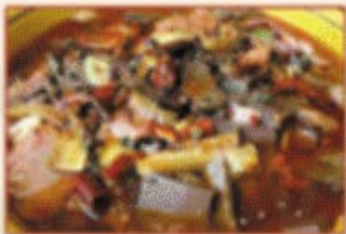
W1. 冒血旺 Chili-Eintopf mit Entenblut und Innereien F,4,8 )) 22,50€