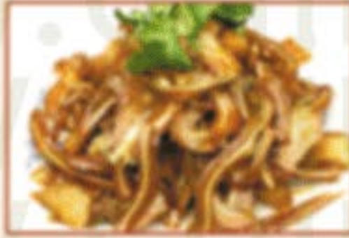
K2. 红油耳丝 Schweineohren in Chiliöl F,O,4 )) 12,00€