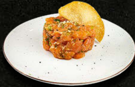
TATAR Z ŁOSOSIA Por, sezam, zuke 55 PLN