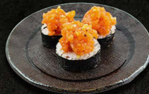
MAKI Z TATAREM Z ŁOSOSIA - 3 SZTUKI 38 PLN