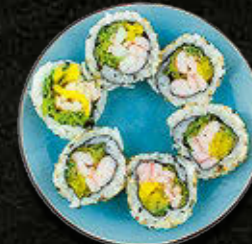
URAMAKI Krewetka parzona, warzywa 45 PLN