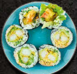
FUTOMAKI Krewetka w tempurze, majonez, warzywa 49 PLN