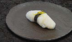
MAŁŻE ŚW. JAKUBA 18 PLN