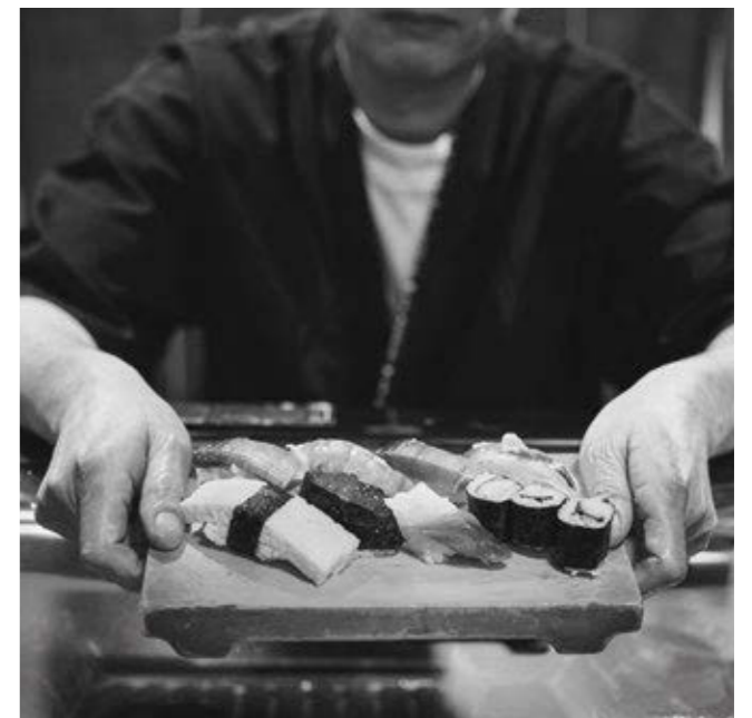
targ rybny tsukiji w tokio, Japonia