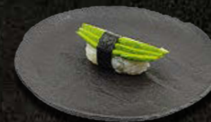
AWOKADO 9 PLN