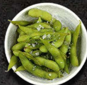
EDAMAME Z SOLĄ MORSKĄ Fasolka sojowa, sól morską Maldon 21 PLN