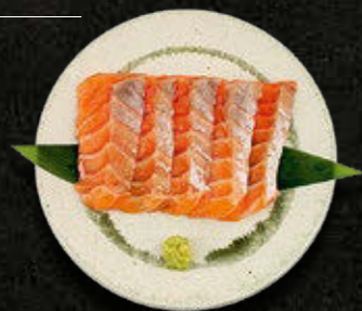
SASHIMI ŁOSOŚ 45 PLN