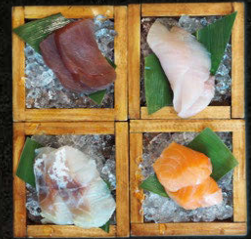
SASHIMI 4X2 Wybór Szefa Kuchni 100 PLN