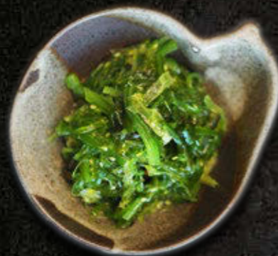
GOMA WAKAME Glony wakame, sos sezamowy 20 PLN