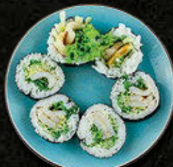
FUTOMAKI Kalmary na maśle czosnkowym, warzywa 51 PLN