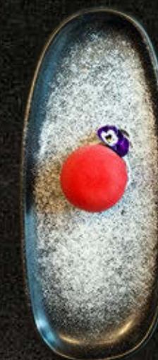
SAKURA 30 PLN