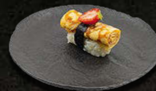
TAMAGO 8 PLN