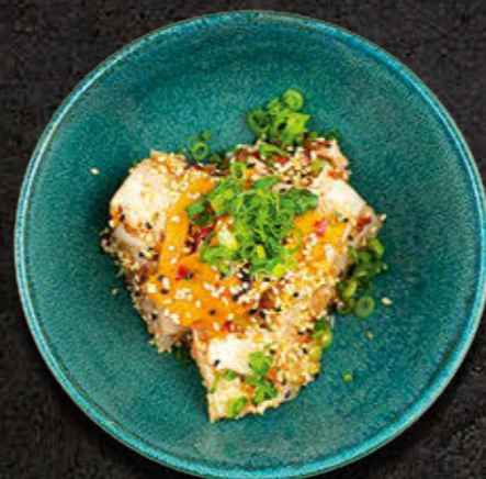
KIMCHI - MAŁA/DUŻA PORCJA Kapusta pekińska, marchewka, rzepa daikon, dymka 15/25 PLN