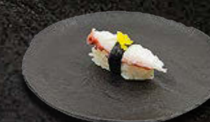
OŚMIORNICA 18 PLN