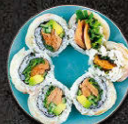
URAMAKI GOLD Pstrąg marynowany wewnątrz, okoń morski na zewnątrz, warzywa 51 PLN