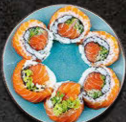
URAMAKI GOLD Łosoś wewnątrz i łosoś na zewnątrz, warzywa 49 PLN