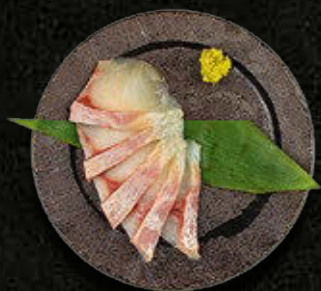
SASHIMI OKOŃ MORSKI 50 PLN