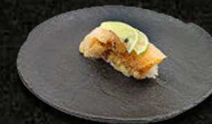
PSTRAĞ 12 PLN