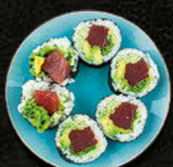
FUTOMAKI Tuńczyk, serek philadelphia, warzywa 40 PLN