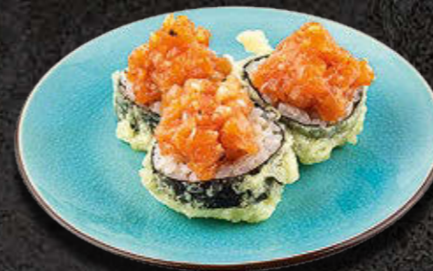
MAKI Z TATAREM Z ŁOSOSIA W TEMPURZE - 3 SZTUKI 43 PLN