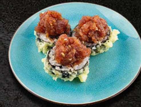
MAKI Z TATAREM Z TUŃCZYKA W TEMPURZE - 3 SZTUKI 49 PLN