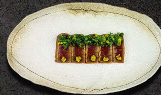
TUŃCZYK PONZU Tuńczyk, sos ponzu, dymka, kizami wasabi, zuke 65 PLN