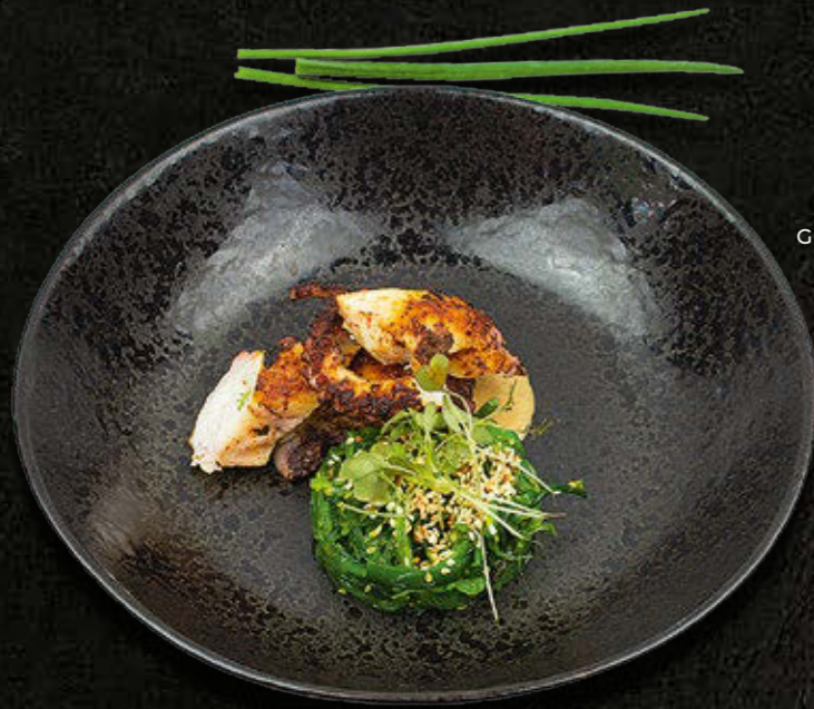
GRILLOWANA OŚMIORNICA Grillowana ośmiornica, sos sezamowy, togarashi, goma wakame 125 PLN