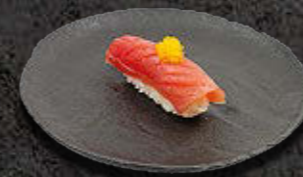
TUŃCZYK 18 PLN