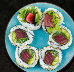
URAMAKI Tuńczyk, warzywa 40 PLN