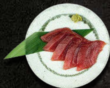
SASHIMI TUŃCZYK 60 PLN