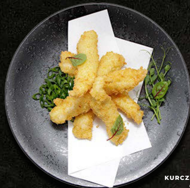
KURCZAK W PANKO 55 PLN