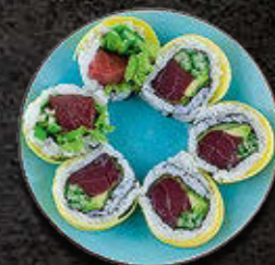
URAMAKI GOLD Tuńczyk wewnątrz, mango na zewnątrz, warzywa 45 PLN