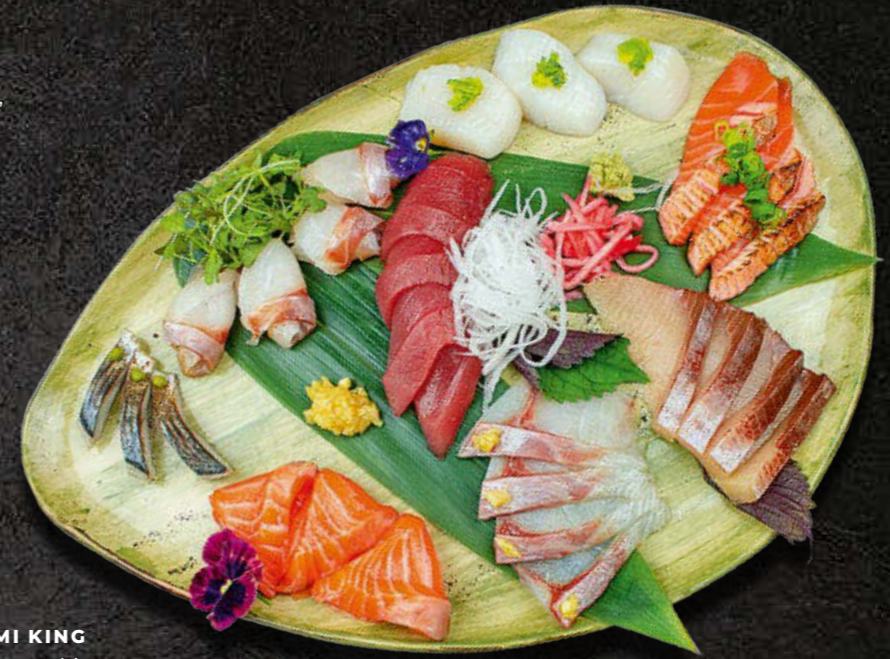
SASHIMI KING Łosoś, łosoś opalany, tuńczyk, okoń morski, dorada, seriola, Ryby egzotyczne małże św. Jakuba 245 PLN