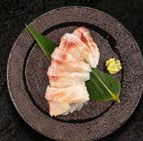
SASHIMI DORADA 50 PLN