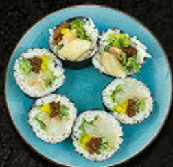
FUTOMAKI Okoń morski, serek philadelphia, warzywa 38 PLN