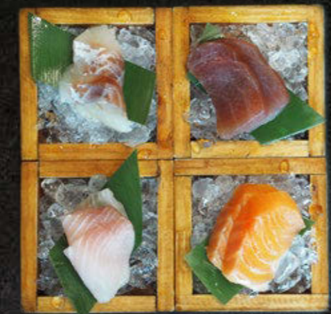
SASHIMI 4X2 Twój własny wybór 120 PLN Łosoś, okoń, dorada, pstrąg, małże, tuńczyk, mahi mahi, papugoryba, lucjan, seriola