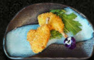
PERLICZKA – 2 szt. 25 PLN