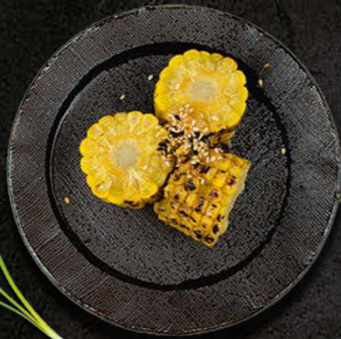
GRILLOWANA KUKURYDZA Grillowana kukurydza, sos sojowy, masło ziołowe i miso 22 PLN