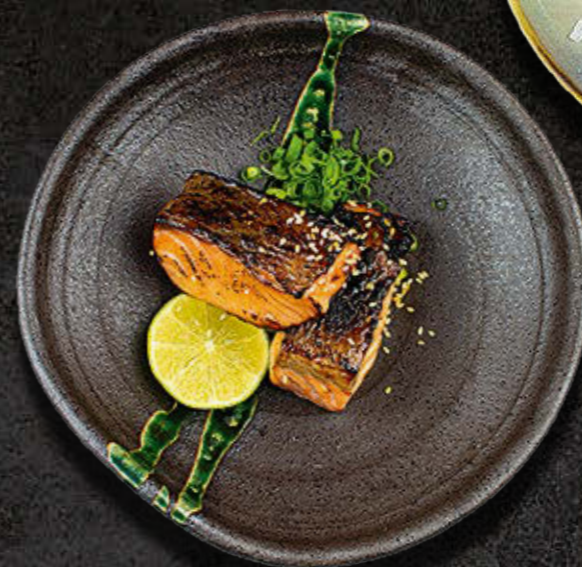
ŁOSOŚ SAIKYO MISO Grillowany łosoś, pomarańczowy sos miso 75 PLN