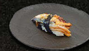
WĘGORZ 16 PLN