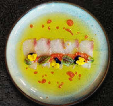
TIRADITO MAHI MAHI Dressing Tiradito, oliwa z pomarańczy, zest z pomarańczy 65 PLN

Uprzejmie informujemy, że doliczamy serwis kelnerski w wysokości 10% do rachunku