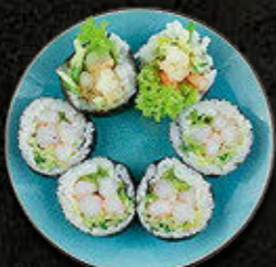
FUTOMAKI Krewetka na maśle czosnkowym, warzywa 51 PLN