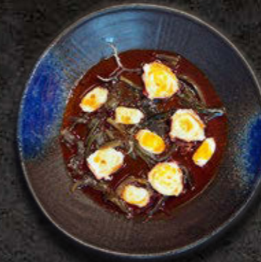
CARPACCIO Z OŚMIORNICY Głony kaiso, żel z limonki, oliwa Rayu 75 PLN