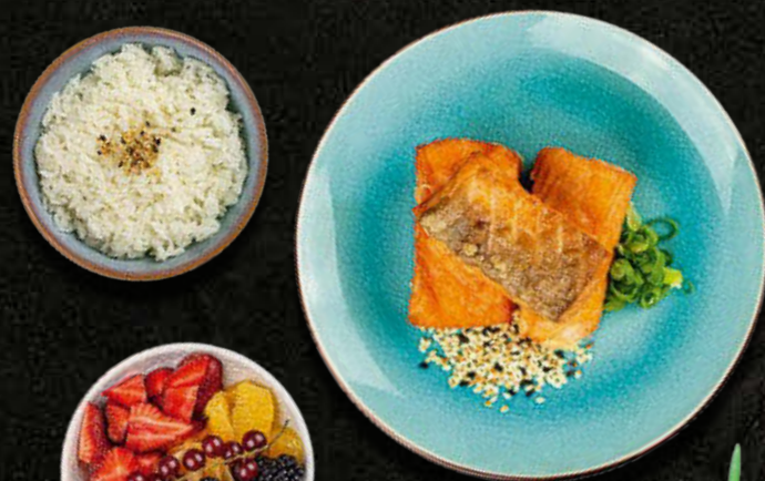
RYBNE PALUSZKI Pieczony łosoś, ryż, owoce 38 PLN