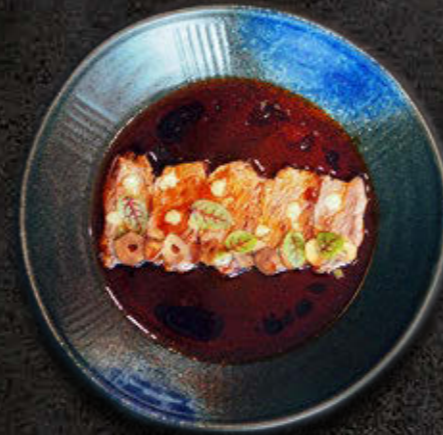
CARPACCIO Z JAŁÓWKI Antrykot z jałówki, oliwa Rayu, karashi/miso, chips z czosnku, zuke, kizami wasabi 85 PLN