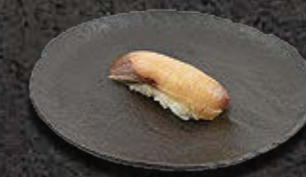
SERIOLA 18 PLN