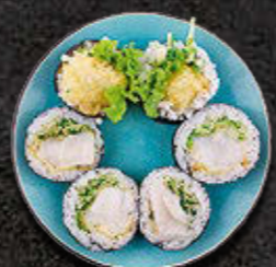
FUTOMAKI Małże św. Jakuba w tempurze, majonez, warzywa 51 PLN