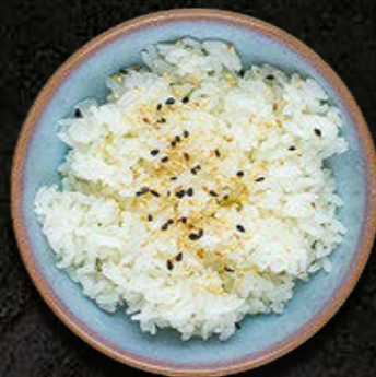
MISECZKA RYŻU 15 PLN