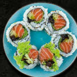
URAMAKI Łosoś, warzywa 36 PLN