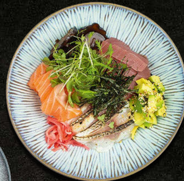
CHIRASHI - DUŻA PORCJA Łosoś, tuńczyk, dorada, grzyby shitake, kizami, nori, awokado, benishoga, sezam, dymka, ryż, sos sojowy 120 PLN