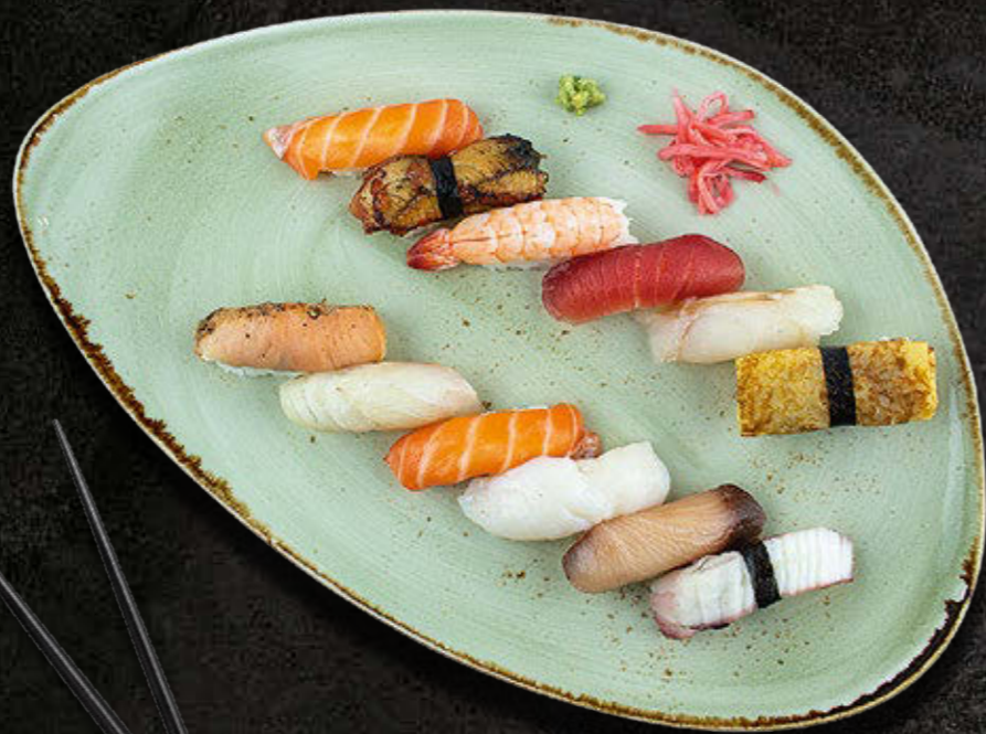
OMAKASE NIGIRI - WYBÓR DNIA SZEFA KUCHNI 12 szt. nigiri 159 PLN