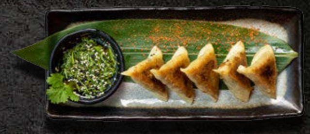
GYOZA – japońskie pierożki wegetariańskie Sos kolendra, sezam 32 PLN