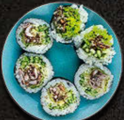
FUTOMAKI Ośmiorniczki w panko na maśle czosnkowym, warzywa 51 PLN