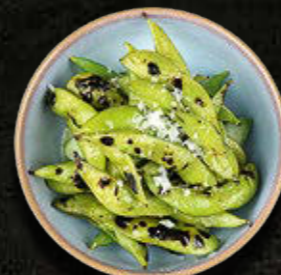
GRILLOWANA EDAMAME Grillowana fasolka sojowa 21 PLN