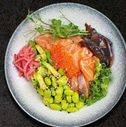
CHIRASHI - MAŁA PORCJA Łosoś, pstrąg, awokado, benishoga, fasolka sojowa edamame, dymka, młody groszek, kawior z pstrąga, ryż, sos sojowy 80 PLN