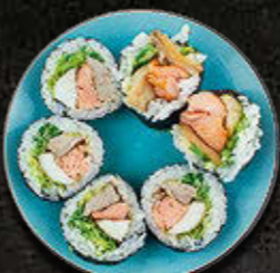
FUTOMAKI Marynowane ryby na ciepło z masłem czosnkowym 47 PLN