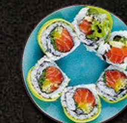
URAMAKI GOLD Łosoś wewnątrz, awokado na zewnątrz, warzywa 45 PLN