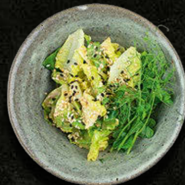
SALAATA GREEN GEM - MAŁA/DUŻA PORCJA Sałata rzymska, dressing sezamowy 15/25 PLN