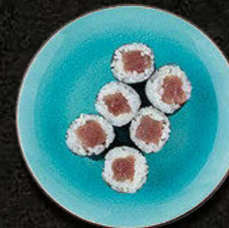
HOSOMAKI Łosoś / dorada / okoń morski / maślana / pstrąg 25 PLN