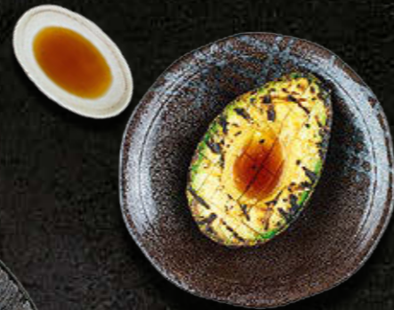
GRILLOWANE AWOKADO 25 PLN