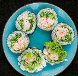
FUTOMAKI Krewetka parzona, majonez, awokado, warzywa 45 PLN