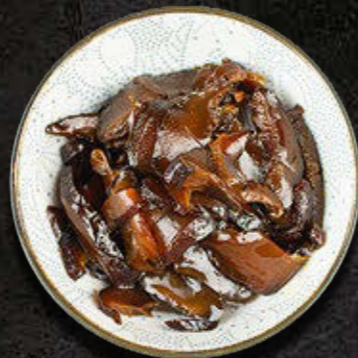
MISECZKA GRZYBÓW SHITAKE 15 PLN