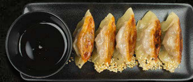
GYOZA – japońskie pierożki Kurczak, sos sezamowy 32 PLN