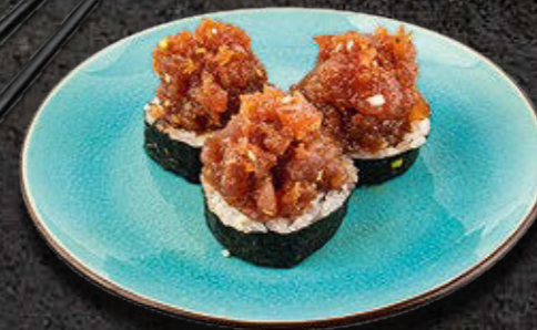
MAKI Z TATAREM Z TUŃCZYKA - 3 SZTUKI 44 PLN