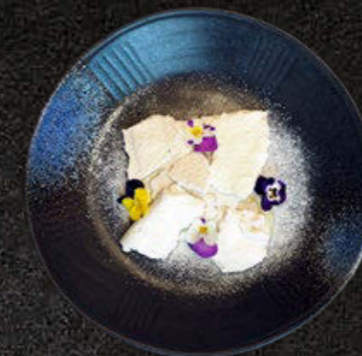
PANDAN CURD 30 PLN