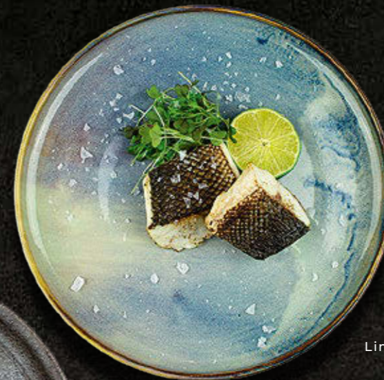
GRILLOWANA DORADA Limonka, sól morska Maldon, galaretką yuzu 75 PLN