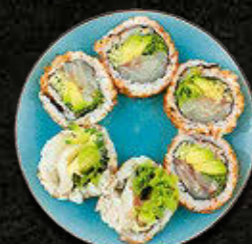
URAMAKI Dorada, warzywa, togarashi 38 PLN