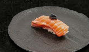
ŁOSOŚ 16 PLN