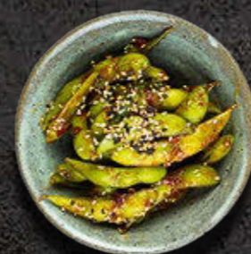
PIKANTNA EDAMAME Pikantna fasolka sojowa 21 PLN