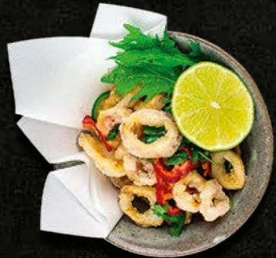
KARAAGE Młode kalmary, chilli, młody szpinak, limonka 57 PLN