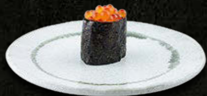
GUNKAN KAWIOR Z PSTRĄGA 27 PLN