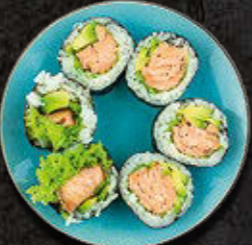
FUTOMAKI Łosoś zapiekany, awokado, warzywa 36 PLN