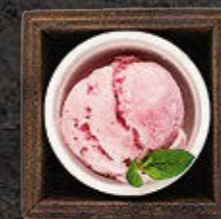
LODY Matcha, Pistacja, Czekolada, Wanilia 11 PLN