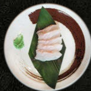
SASHIMI PAPUGORYBA 60 PLN