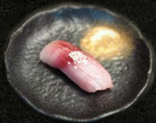
LUCJAN 18 PLN