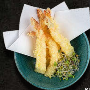
KREWETKI LUB KALMARY W TEMPURZE – 5 szt. 65 PLN