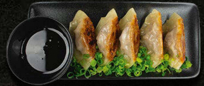
GYOZA – japońskie pierożki Wołowina, kimchi, sos chilli 35 PLN