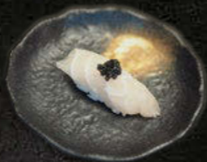
MAHI MAHI 18 PLN