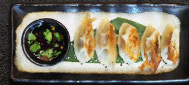
GYOZA – japońskie pierożki Kaczka, sos z bazylii tajskiej 39 PLN