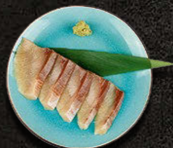
SASHIMI SERIOLA 70 PLN