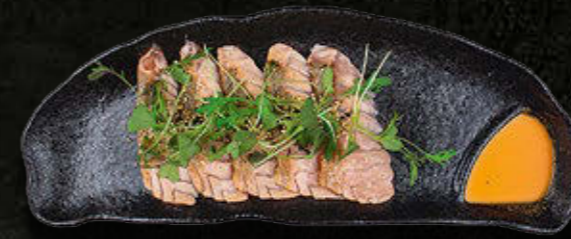
CARPACCIO Z ŁOSOSIA Opiekany łosoś, sezam, zuke, sól, oliwa paprykowa, pieprz, oliwa z nasturcji 55 PLN