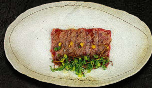
CARPACCIO Z POŁĘDWICY WOŁOWEJ Wołowina, por, kizami wasabi 65 PLN