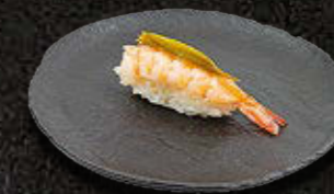
KREWETKA 16 PLN