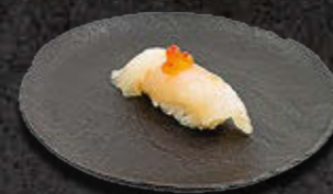
OKOŃ MORSKI 16 PLN