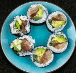
FUTOMAKI Seriola, limonka, mięta, serek Philadelphia, warzywa 51 PLN