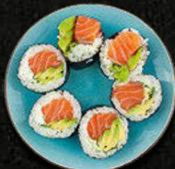
FUTOMAKI Łosoś, serek philadelphia, awokado, warzywa 36 PLN