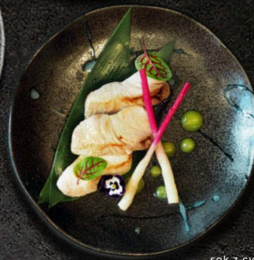
MAHI MAHI Młode pędy imbiru, sok z cytrusów, sól morska Maldon 95 PLN