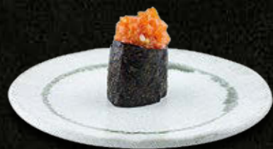
GUNKAN TATAR Z ŁOSOSIA 18 PLN