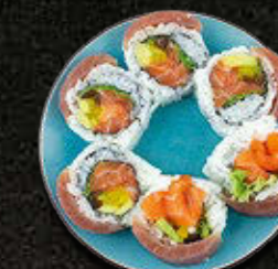
URAMAKI GOLD Łosoś wewnątrz, tuńczyk na zewnątrz, warzywa 51 PLN