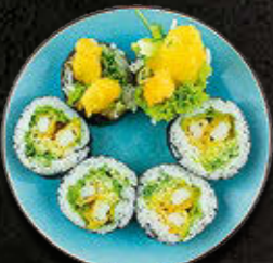
FUTOMAKI Kalmar w tempurze, majonez, warzywa 49 PLN