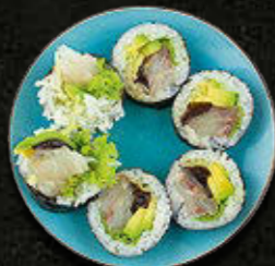
FUTOMAKI Dorada, serek philadelphia, warzywa 38 PLN