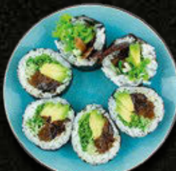
FUTOMAKI Vegetariańskie 31 PLN