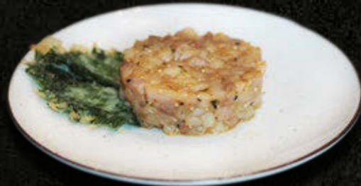
TATAR Z SERIOLI Karmel yuzu, pieprz sansyo, zuke, zest z limonki, shiso w tempurze 85 PLN