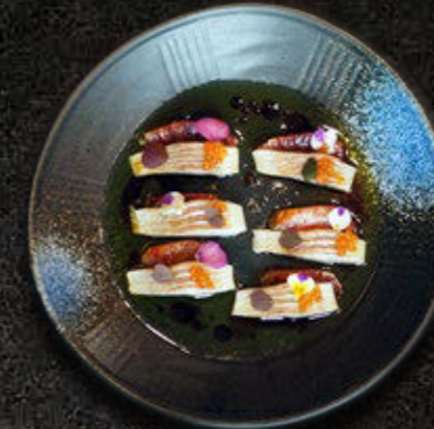
CARPACCIO Z PSTRĄGA Pstrąg, kawior z pstrąga, gruszka Nashi, pomarańcza Tiger blood, oliwa z kolendry, zuke 55 PLN