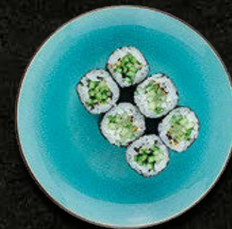
HOSOMAKI Z warzywami 18 PLN