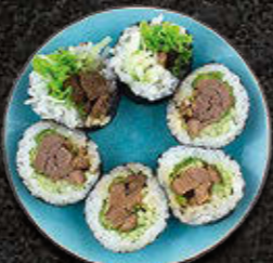
FUTOMAKI Marynowana wołowina, masło czosnkowe, warzywa 51 PLN