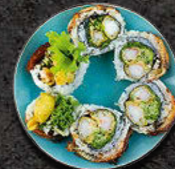
URAMAKI GOLD Krewetka w tempurze wewnątrz, węgorz na zewnątrz, słodki sos, warzywa 51 PLN