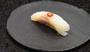
DORADA 16 PLN