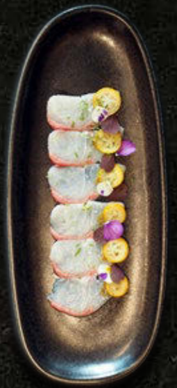
CARPACCIO Z SERIOLI Zest z limonki, Yuzu Kosho, sok z limonki, kumkwat, sól 85 PLN