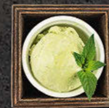
SORBETY Limonka z miętą, Marakuja 11 PLN