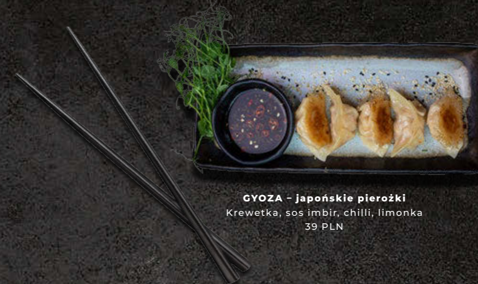
GYOZA – japońskie pierożki Krewetka, sos imbir, chilli, limonka 39 PLN