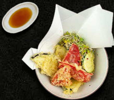
TEMPURA WEGETARIAŃSKA – 7 szt. 40 PLN