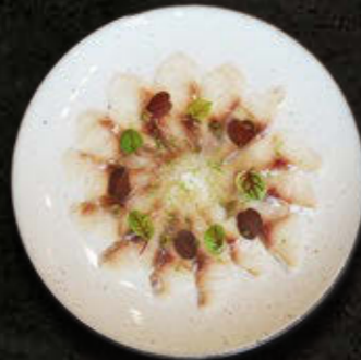
URUSUZUKURI Z OKONIA MORSKIEGO Zest z limonki, Yuzu Kosho, mikro zioła, sól 65 PLN