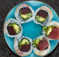
URAMAKI GOLD Tuńczyk wewnątrz, dorada na zewnątrz, warzywa 51 PLN