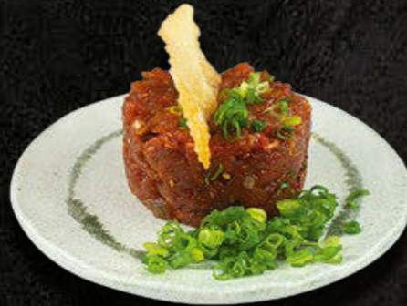
TATAR Z TUŃCZYKA Por, dymka, zuke 65 PLN