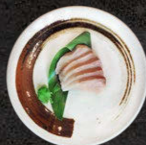
SASHIMI LUCJAN 60 PLN