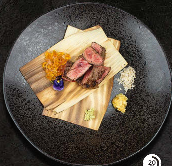
GRILLOWANA JAŁÓWKA Wołowina, kizami wasabi, imbir, sól 125 PLN