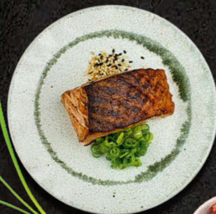
GRILLOWANY ŁOSOŚ Łosoś, ryż, sezonowe owoce 38 PLN