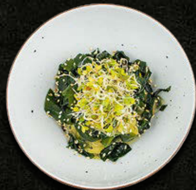
WAKAME Glony morskie, ogórek 20 PLN