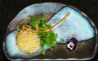
JAGNIĘCINA – 1 szt. 35 PLN