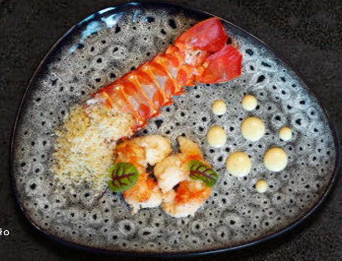
HOMAR Grillowane panko, sos aioli, masło 250 PLN