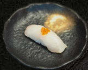
PAPUGORYBA 18 PLN