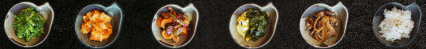
WYBIERZ SWOJE 3 DODATKI DO DAŃ GŁÓWNYCH Goma wakame, kimchi, japońskie pikle, wakame, grzyby shitake, ryż