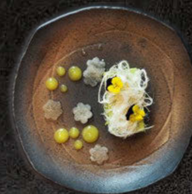
MATCHA 30 PLN